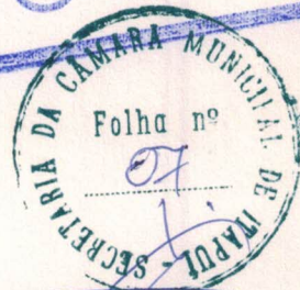
ABIBI ÁZAR Prefeito Municipal

PREFEITURA MUNICIPAL DE ITAPUÍ, 25 DE MARÇO DE 1999