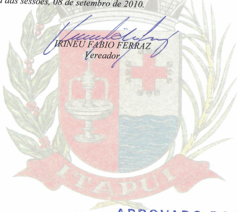
IRINEU FABIO FERRAZ Vereador

Sala das sessões, 08 de setembro de 2010.